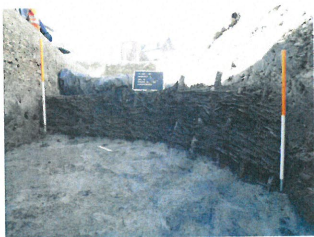
Zicht op de recentste beschoeiing van de drenkpoel

Reeds in 2005 was vastgesteld dat er in de vullingen van de poel verschillende gebruiksfasen te herkennen zijn. Deze zijn van elkaar gescheiden door middel van een houten beschoeiing, die bestaat uit ingeheidde paaltjes en vlechtwerk. Bij het huidige onderzoek konden minstens zeven verschillende gebruiksfasen herkend worden, die te dateren zijn tussen de 14 de en het begin van de 16 de eeuw. Deze zijn