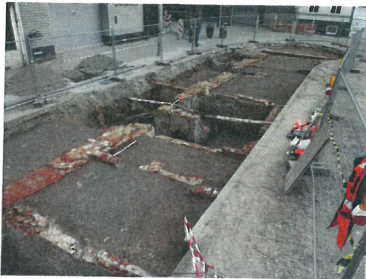
Zicht op de oostelijke pandgang en pandhof

Slechts tweederde van de oorspronkelijke breedte van de oostelijke pandgang kon onderzocht worden doordat de buitenmuur zich bevond onder het huidige trottoir. Aansluitend aan de pandgang bevond zich in de sleuf de pandhof. Zowel in de pandhof als in de pandgang zijn na de opgave van het klooster in 1797 kelders gegraven. Deze kunnen in verband worden gebracht met de 19 de - en 20 ste -eeuwse bewoning die de oorspronkelijke kloostereigendommen aan deze zijde opdeelde in vijf woningen. Van deze woningen zijn overigens niet alleen de kelders, maar ook de tussenmuren op grondbogen en enkele funderingen van haarden aangetroffen.