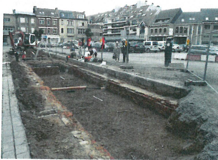
Zicht op de zuidelijke pandgang

Ter hoogte van het westelijke deel van deze sleuf is bovendien een deel van het, na 1797 onderkelderde, woongedeelte van het klooster blootgelegd.