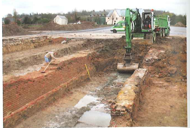
Archeologen leggen de muur van de tweede stadsomwalling op De Ham bloot

Het succes van beide steden is af te leiden uit de grote 13de-eeuwse stadsuitbreiding, waarbij Oudenaarde en Pamele binnen dezelfde stadsomwalling kwamen te liggen, weliswaar nog steeds gescheiden door de Schelde. Het was de eerste stap naar de opslorping van Pamele door Oudenaarde. Aanvankelijk bestond de nieuwe versterking uit een gracht en een aarden wal van ongeveer tweeënhalf kilometer lang, maar al snel, rond 1290, volgde een versterking. De nieuwe stadsmuur telde dan vijf grote poorten die vanuit alle windrichtingen toegang verschaften tot de stad. De 42 hectare grote stad heeft sindsdien de vorm van een peer, die ook vandaag nog vanuit de lucht te herkennen is.