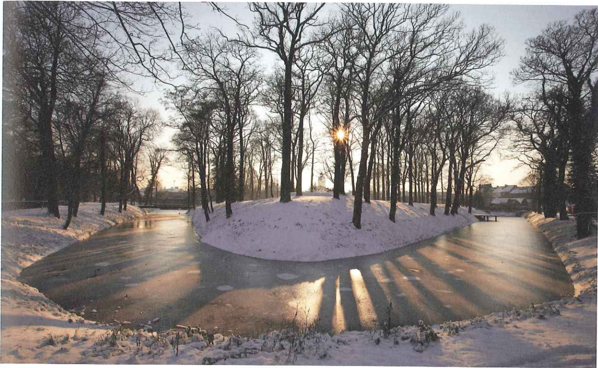
De gerestaureerde gracht in het Liedtspark