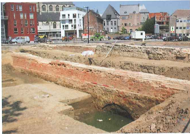
De muur van de tweede stadsomwalling op De Ham tijdens het onderzoek