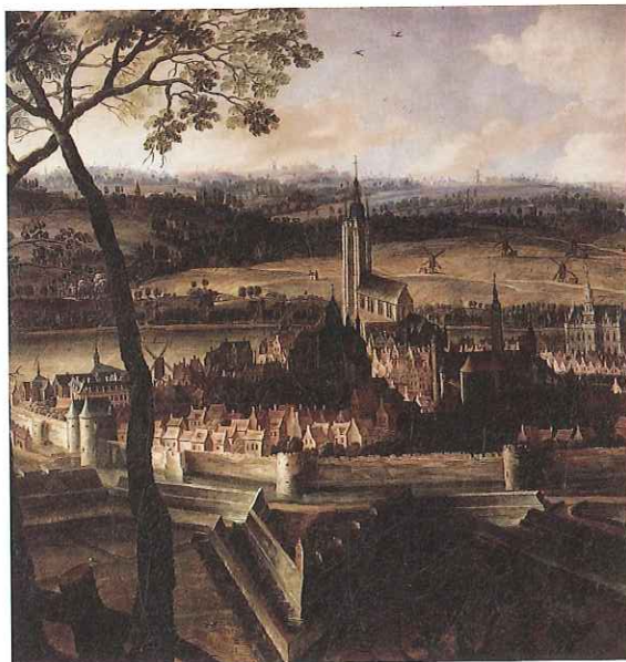
Panorama van Oudenaarde, I.D. Maire, 1667 © Schepenzaal Oudenaarde

Het succes van beide steden is af te leiden uit de grote 13de-eeuwse stadsuitbreiding, waarbij Oudenaarde en Pamele binnen dezelfde stadsomwalling kwamen te liggen, weliswaar nog steeds gescheiden door de Schelde. Het was de eerste stap naar de opslorping van Pamele door Oudenaarde. Aanvankelijk bestond de nieuwe versterking uit een gracht en een aarden wal van ongeveer tweeënhalf kilometer lang, maar al snel, rond 1290, volgde een versterking. De nieuwe stadsmuur telde dan vijf grote poorten die vanuit alle windrichtingen toegang verschaften tot de stad. De 42 hectare grote stad heeft sindsdien de vorm van een peer, die ook vandaag nog vanuit de lucht te herkennen is.