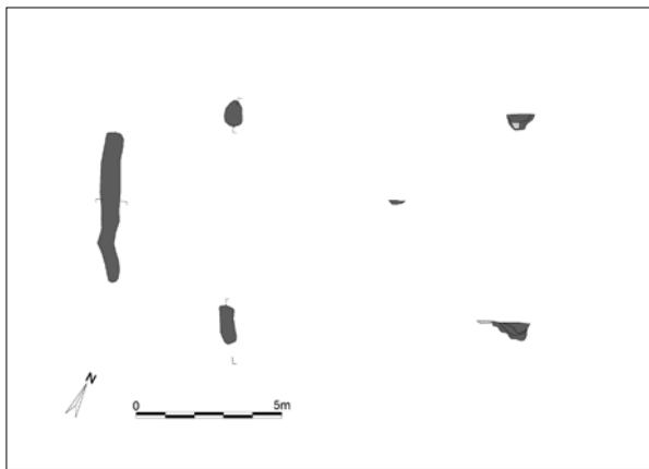
Fig. 2. Het gebouw in grondplan en in coupe.

vondst is een site uit het finaal paleolithicum. 6 Verder waren sporen uit het neolithicum, de late ijzertijd en de vroege middeleeuwen aanwezig. 7 De vondsten uit de Romeinse periode zijn eerder schaars: een mogelijk wegtracé, een fragment van een klein, rechthoekig enclosure en een brandrestengraf. 8