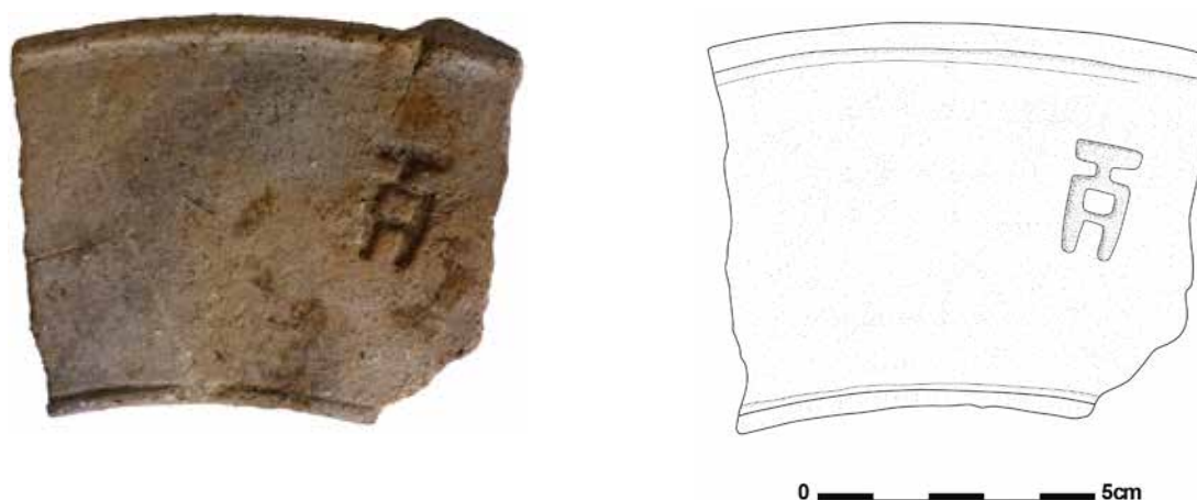
Fig. 3-4. Bovenaanzicht van de rand van het dolium .

rand naar het lichaam is duidelijk gemarkeerd en zelfs licht “ondersneden”. Het oppervlak is lichtbruin en ruw; de kern is donkergrijs. Een macroscopische studie toont een vrij grove verschraling van veel, kleine en middelgrote brokjes kwarts en kleine en middelgrote brokjes (bruin)rode chamotte. De breedte van de rand bedraagt 7 cm. Het stuk is te slecht bewaard om een betrouwbare diameter te reconstrueren, de geschatte binnendiameter bevindt zich ongeveer tussen 25 en 35 cm.